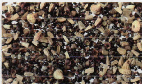
B 85 Sommerblumenmischung Blütenmeer

Mischung aus 2-jährigen, ausdauernden Sorten mit intensiven Farben in karmesinrot, rosa, dunkelviolet, weiß und gelb als Kontrast. Akelei, Muskatellersalbei, Sonnenhut, Bartnelke und viele andere. Bei früher Aussaat blühen einige Arten schon im 1. Jahr. Vorkultur ab März, Pflanzung ab April/Mai. Direktsaat breitwürfig ab Mai.