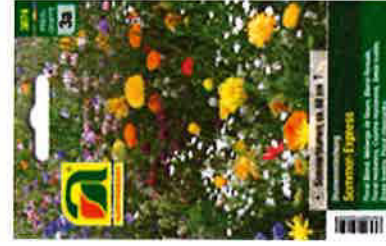
Blumenmischung „Sommer Express“