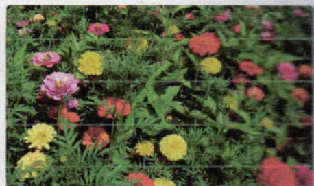
B 166 Sommerblumenmischung Sommertraum

Reichblühende, bunte Mischung aus Blumen und Wiesenkräutern. Margerite, Wiesensalbei, Klatschmohn u.a. fügen sich ab dem 2. Jahr zu bunten Sträußen zusammen. Blüte Mai bis September. Direktsaat breitwürfig ab April. Beimischung von feinem Quarzsand als Streumittel wird empfohlen.