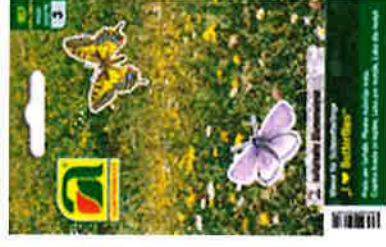
Wiese für Schmetterlinge „I. © Butterflies“