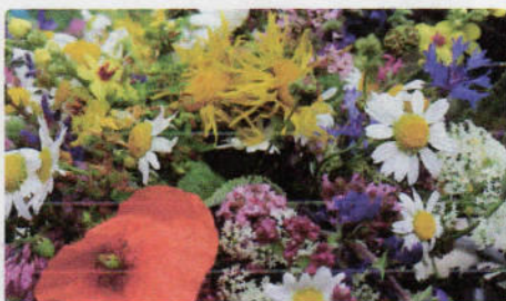
B 199 Feldblumen-Mischung

Mischung aus 2-jährigen, ausdauernden Sorten mit intensiven Farben in karmesinrot, rosa, dunkelviolet, weiß und gelb als Kontrast. Akelei, Muskatellersalbei, Sonnenhut, Bartnelke und viele andere. Bei früher Aussaat blühen einige Arten schon im 1. Jahr. Vorkultur ab März, Pflanzung ab April/Mai. Direktsaat breitwürfig ab Mai.