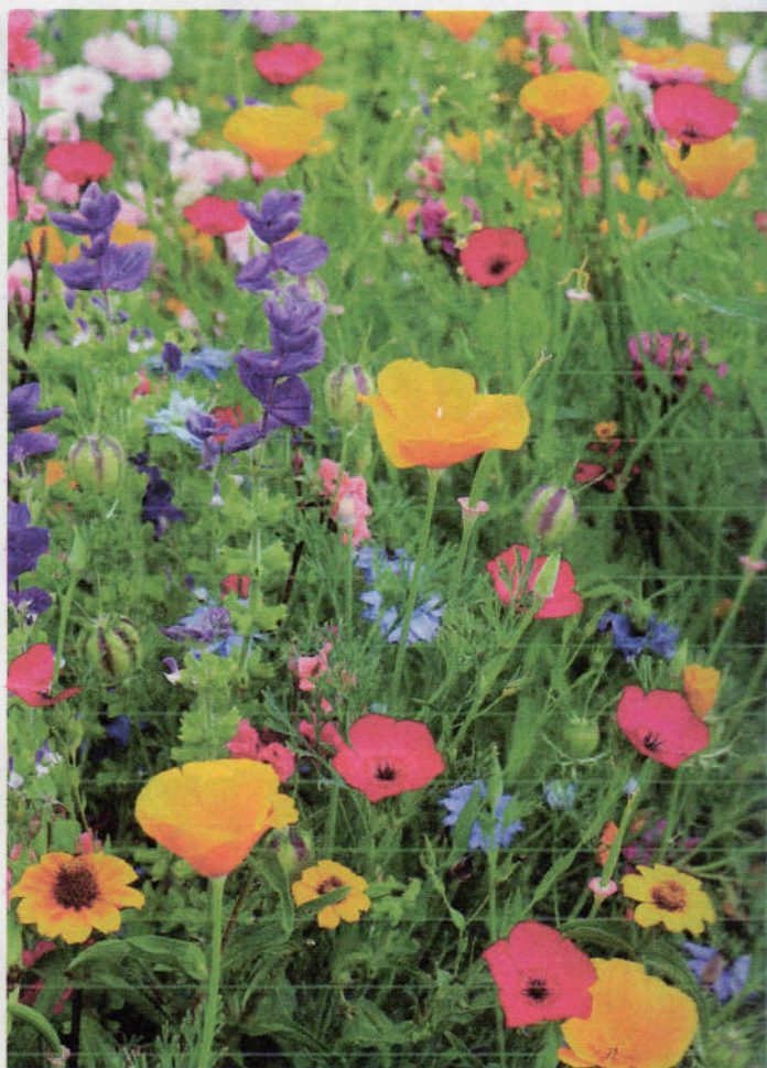
B 84 Sommerblumenmischung Feenwiese

Reichblühende, bunte Mischung aus einjährigen Blumen und Kräutern von Salbei über Phacelia bis Malve, die als Bienenweide besonders für Imker zusammengestellt wurde. Auch die Aussaat in der sonnenexponierten Rabatte ist möglich. Direktsaat März/April, breitwürfig und leicht einarbeiten. Saatgutbedarf ca. 100 g/a.