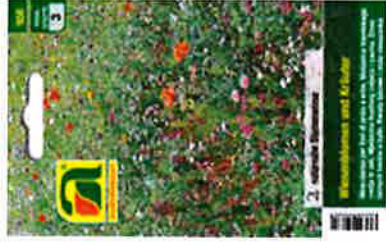
Wiesenblumen- und Kräutermischung