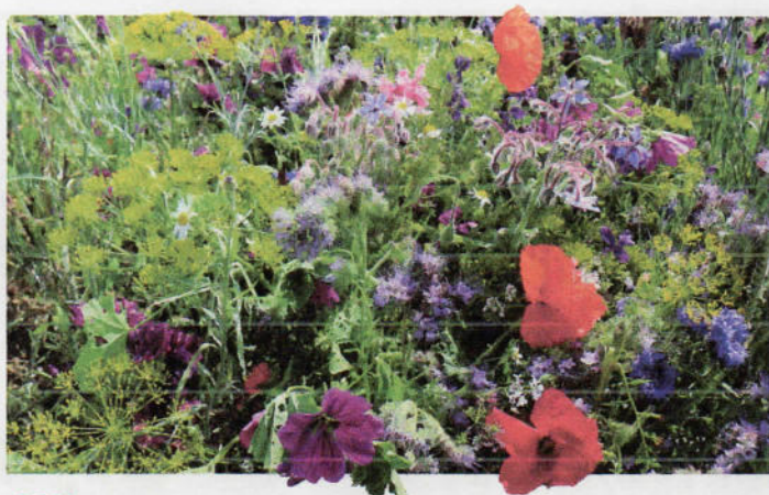
B 170 Blümmischung Bienenproviant

Mittelhoch bis hoch wachsende, ein- bzw. mehrjährige Mischungen. ✿ Portionsinhalt »Sommerblumenmischung« reicht für ca. 1,5 m 2 bei Direktsaat und 2,5 m 2 bei Anzucht. ✿ »Feldblumen Mischung« reicht für ca. 2 m 2 . ✿ Änderungen bei den Mischungsanteilen und Artenzusammensetzung sind möglich.